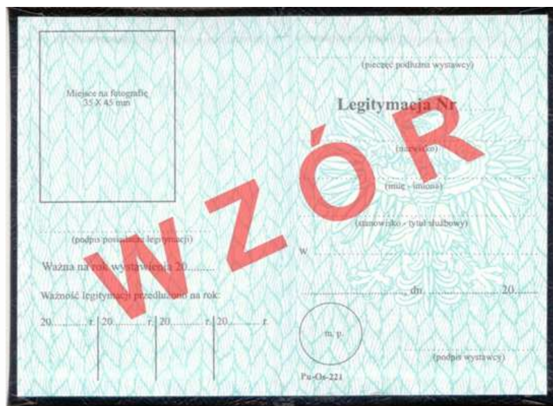
Wzór legitymacji ankietera stałego